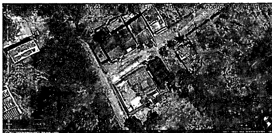
Figura 1. Ubicación del punto de medición de ruido ambiental – La Isla Gastro Bar, Turbaco