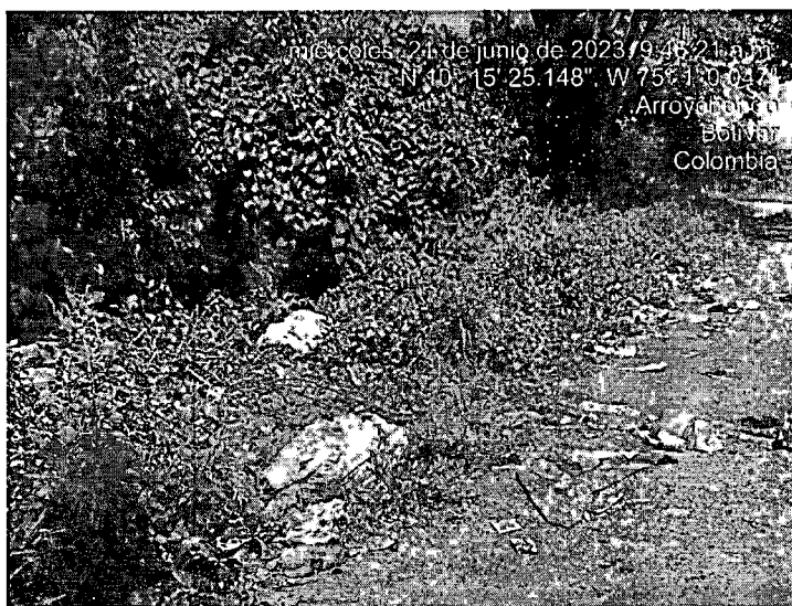
Imagen 2. Botadero satélite Vía hacia Sato

Coordenadas: 10°15'25.148"N- 75°01'0.047"O