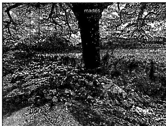
Imagen 2. Botadero satélite Vía hacia Sato

Punto crítico No. 1: Vía hacia Sato Coordenadas: 10°15'20"N- 74°01'07"O