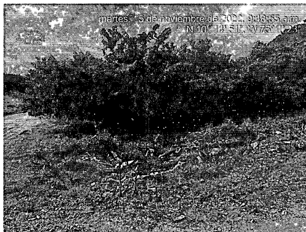
Imagen 5. Botadero satélite Entrada al municipio vía Mahates

Se evidenció presencia de residuos domiciliarios como botellas plásticas, recipientes de un solo uso, bolsas plásticas, empaques, así como gran cantidad de residuos de poda. Se evidenció rastro de quema a cielo abierto de residuos y olores ofensivos.