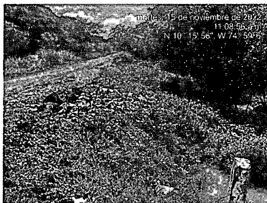
Imagen 3 y 4. Botadero satélite Entrada a Sato