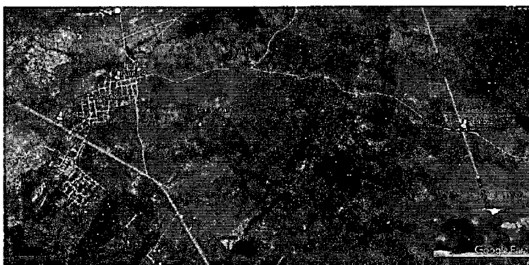
Imagen 1. Georeferenciación de los botaderos satélite visitados

"Por la cual se hacen unos requerimientos y se dictan otras disposiciones"