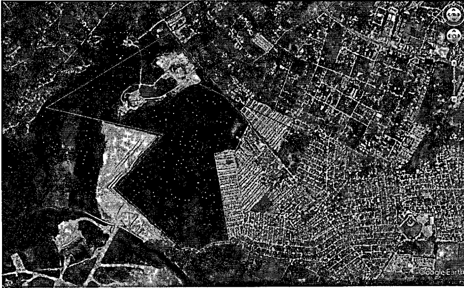
Figura 3. Imagen Google Earth del título minero 10350, ilustra en color amarillo la integración del área definitiva del Plan de Manejo Ambiental

2. La Zonificación de Manejo Ambiental quedara tal y como se puntualiza en la resolución 1217 de fecha 17-07-2017 por la cual se modificó el Plan de Manejo de la Sociedad CIMACO S.A.S., y la delimitación de su área se ajustará a las coordenadas proporcionadas en la tabla No. 1 del presente concepto técnico.