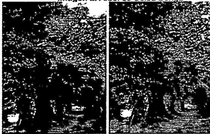
• Imagen 2. Arbol de Ceiba Bonga

Teniendo en cuenta las consideraciones expuestas anteriormente, evidenciandose el riesgo que representa el árbol de Mamon ( Melicoccus bijugatus ), ante su posible caída por su deficiente estado fitosanitario, pudiendo causar accidentes a los transeuntes de la calle Ricuate del municipio de Turbana, se considera procedente dar permiso al solicitante para efectuar la tala del árbol de especie Mamon