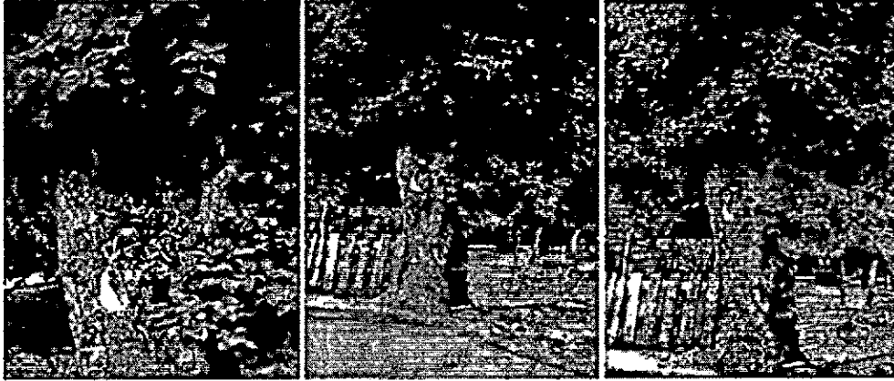
Imagen 1. Arbol de Mamon

"Por medio de la cual se autoriza una tala de emergencia y se dictan otras disposiciones"