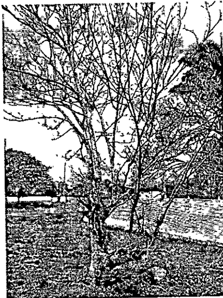
Ilustración 5. Ciruelo