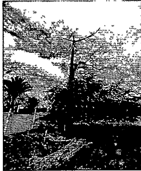
Ilustración 2. Árboles de Roble