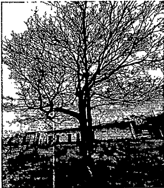
Ilustración 1. Árbol Indeterminado

Un quinto árbol de Ciruelo ( Spondias purpurea ) que está ubicado en la zona verde a 15 mentros despues de cruzar la puerta interna de ingreso al complejo, es un árbol que está muerto y seco, que genera riesgo de caidas de ramas.