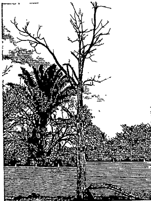
Ilustración 4. Polvillo