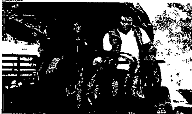
Figura x. Iguanas amarradas de sus extremidades colgando de ramas o palos secos.

Se encontraron evidencias protuberantes respecto a que hubo maltrato animal por la forma de sujeción de las iguanas que estaban amarradas con sus extremidades colgando de ramas secas y la acumulación de las hicoetas en sacos de fique y polietileno alterando su ciclo de vida natural además de la abrupta extracción de su hábitat.