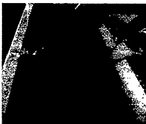
Figura No.2. Actividad de hidratación de las hicoetes en el Vivero Mata de Caña

Recibidos los especímenes incautados la Corporación decide su traslado al Centro Mata de Caña propiedad de CARSUCRE con el objeto de brindarle procedimientos para la estabilización de los ejemplares y restauración de su bienestar animal mientras se analizaba y decidía la alternativa menos traumática de los especímenes incautados para su disposición final y/o provisional según la normatividad vigente.