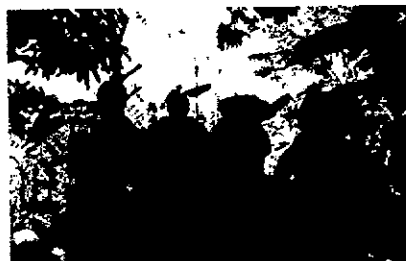
Figura 2. Procedimiento de verificación de (1165) Trachemys callirostris - Hicoetas y (85) Iguana-iguana Acta única de control al tráfico legal de flora y fauna silvestre N° 212676.

Carrera 25 Ave Ocala 25-101 Teléfono: Conmutador 605 - 2762037 Línea Verde: 605 - 2762045 Web: www.carsucre.gov.co E-mail: CarSucre@carsucre.gov.co Sincelajo - Sucre