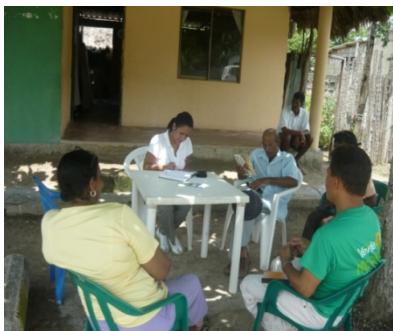
Mesa de trabajo con el representante legal de ANUC y su Junta Directiva en el municipio de Soplaviento.