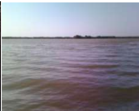
Ciénaga de la Virgen