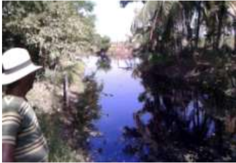
Finca La tierrita - Piscina de cultivo de peces