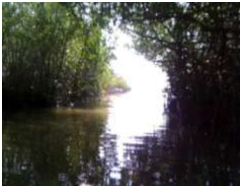
Salida Canal Puerto hacia Ciénaga de la Virgen