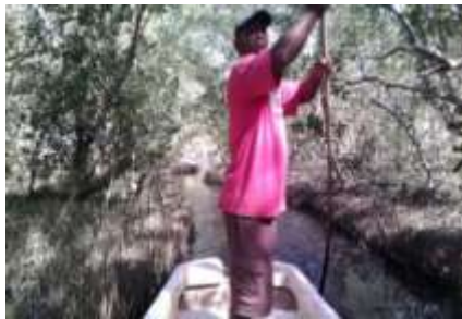
Canal Puerto Rey a tomar muestras