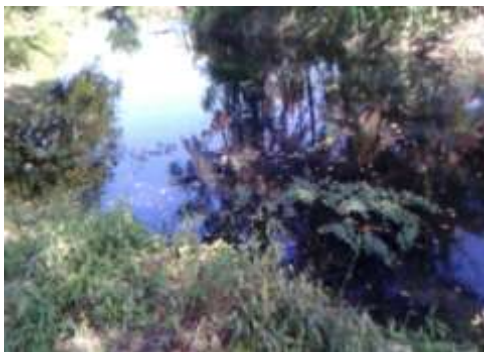
Toma de muestras de agua