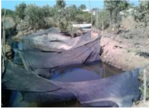
Piscina del Señor AnibalPineda