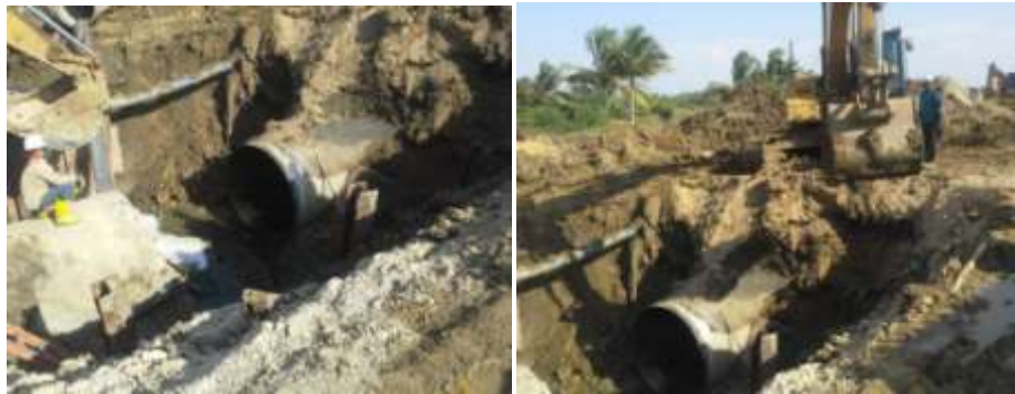
Tubería en pruebas para ser colocada en la conducción en reemplazo de la tubería rota.