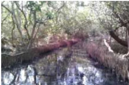
Canal Puerto Tránsito