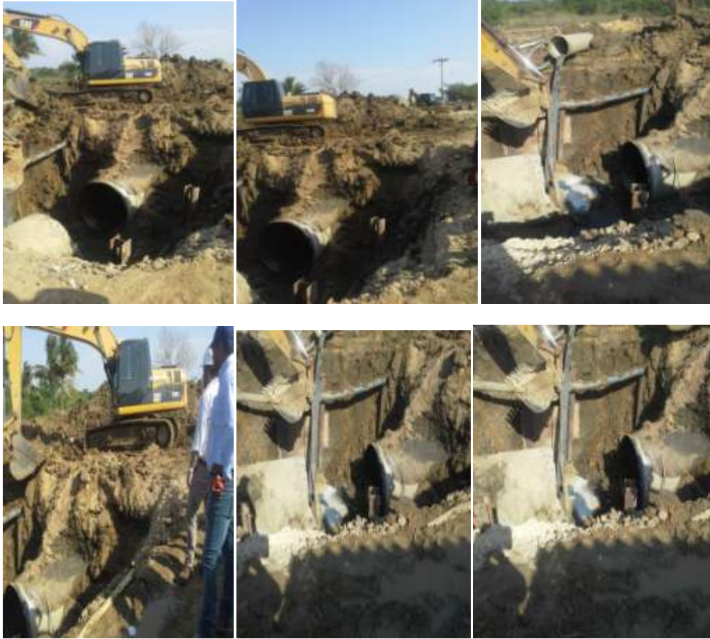
Trabajos de Reparación de la tubería.