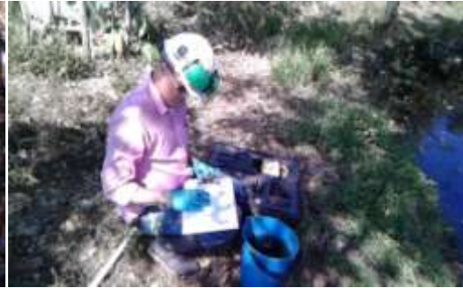
Toma de muestras de agua Finca La tierrita - Piscina de cultivo de peces