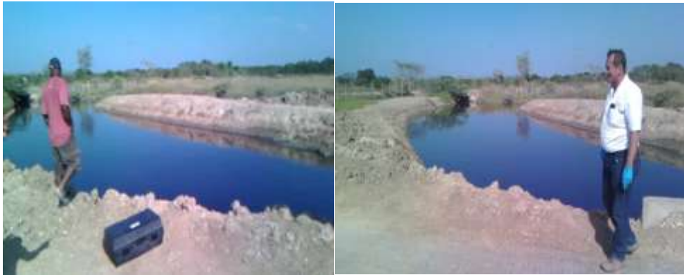
Canal Puerto Rey