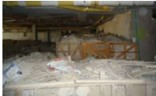
Retal de Marmol