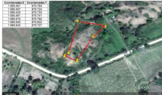
Tabla 1. Localización del proyecto

Para llegar al lote se toma la vía 90 (Transversal del Caribe) al partir desde Cruz del Viso, pasa por corregimiento San Pablo, se llega hasta el caserío denominado “El Sena”, a partir de allí a mano izquierda se toma el carretable que conduce al corregimiento de Mampujan, y a una distancia de 1,7 Km se encuentra el lote.