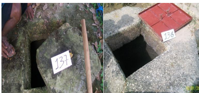
Fig 7 tramo 137-138 Fig 8 Tramo 138 – descarga

En el municipio de Arjona no existe sistema de tratamiento de aguas residuales, estas son vertidas al Arroyo Caimital sin tratamiento previo.