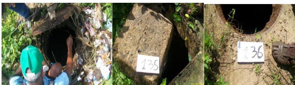
Fig 4 Tramo 134-135