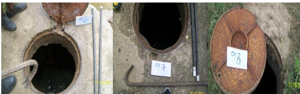
Figura 1 Tramo 96-97