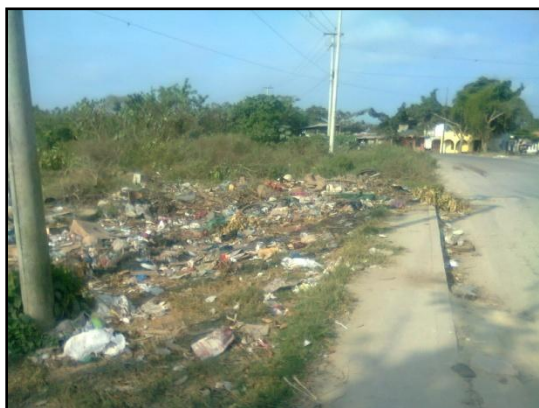
Foto 3. Botadero sector La Cruz