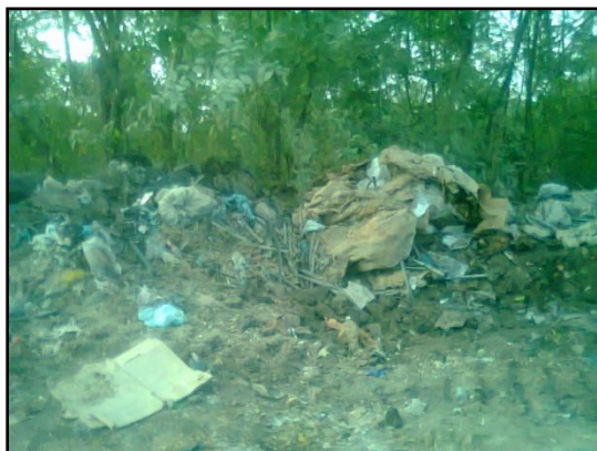
Foto 1. Botadero vía Turbana. Finca Bocao del Rey

Existen aproximadamente, otros quince (15) botaderos satélites en los que la empresa no realiza limpieza, debido a que el municipio no los entregó erradicados al momento de contratar la prestación del servicio de aseo con esta empresa".