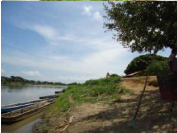
Fotos. Obsérvese el deterioro o desgaste de la base del jarillón en Soplaviento

Este desgaste ocasiona filtraciones, cuando se crece el Canal, las cuales inundan el pueblo y a su vez deterioran el Jarillón hasta derrumbarlo. No se observó presencia de árboles que se puedan ver afectados por los trabajos.