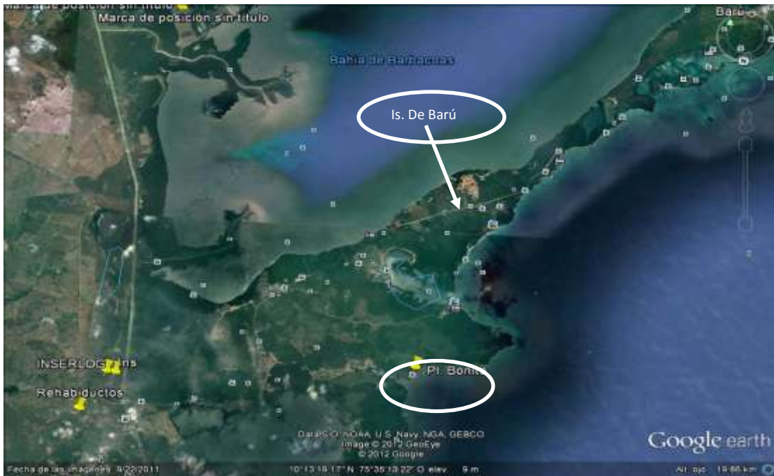
Localización de la playa a concesionar ante la DIMAR.