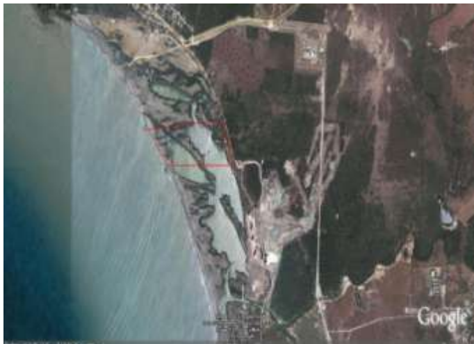
Localización de la concesión de playa en Punta Canoa – Inversiones Gerdts Porto y Cía S. en C.