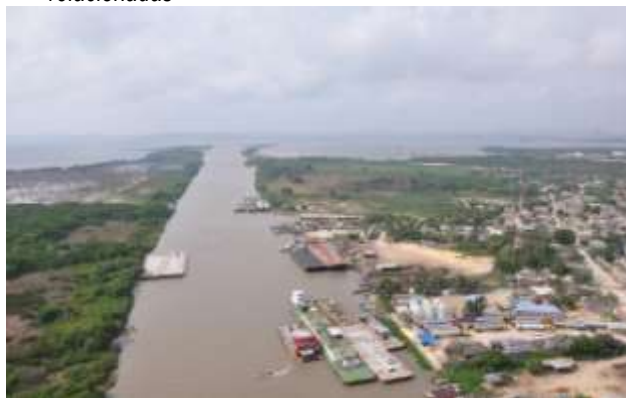
Fig. 2-2. Foto Desembocadura Canal del Dique. Actividades relacionadas

Actualmente en el entorno del predio localizado en el corregimiento de Pasacaballos se vienen desarrollando actividades comerciales, Industriales y Portuarias, debido a la cercanía con el Canal del Dique y la bahía de Cartagena.