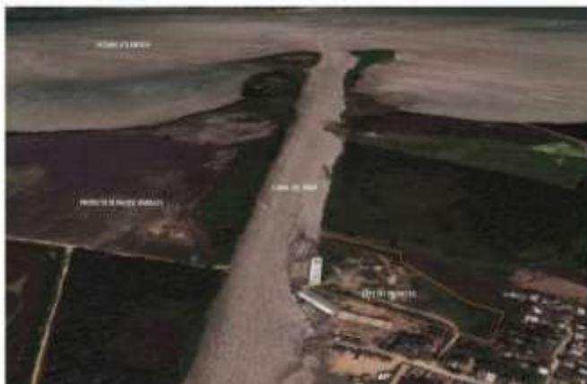
Figura 2-1. Ubicación de la Planta

Las actividades del proyecto de construcción de la terminal para la recepción, almacenamiento y distribución de combustibles líquidos provenientes de diferentes empresas del sector de hidrocarburos, que realizará la empresa CI TECA PETROLEUM COMPANY S.A.S., se localizará en el Departamento de Bolívar, ciudad de Cartagena, en el corregimiento de Pasacaballos sector El Puerto, colindante con el canal del Dique, en las coordenadas X : 0841968, Y: 1629572, distinguido con la nomenclatura: calle 20 N° 5-15.