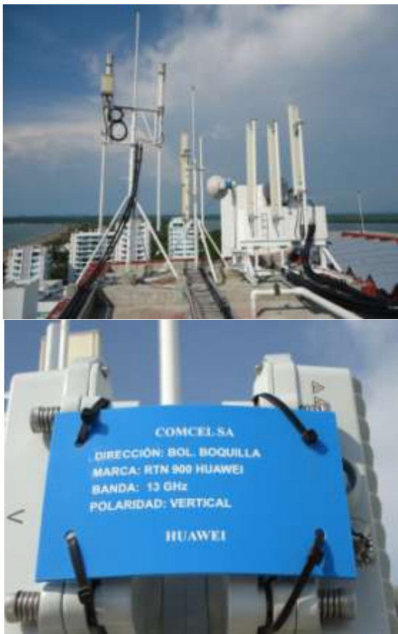
Fotos: equipos y mástiles auto soportados en la azotea del edificio Los Morros Ultras – Hotel HolidayInn