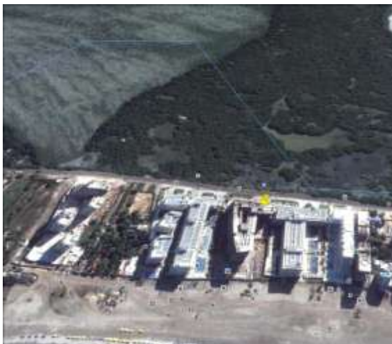
Localización Edificio Morros Ultra