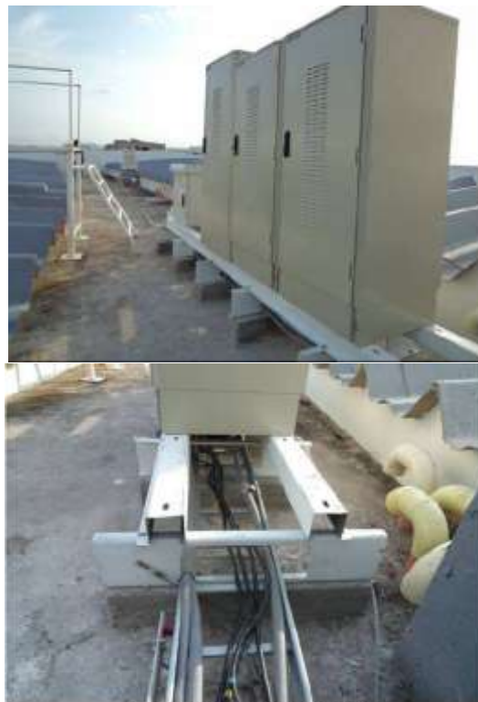
Figura 14. Hialotoma metálica equipos TICSO

Se propone que los soportes para antenas sean instalados sobre el punto fijo de la edificación ubicado en el nivel NE+ 47.35m. Como: 2 soportes metálico para antenas, 6 antenas rimsa y 1 antena MW