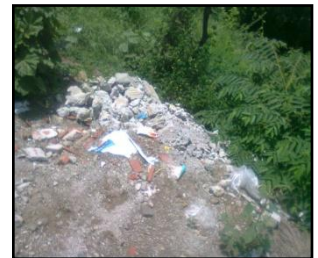
Foto 1, 2 y 3. Residuos dispuestos en cercanías a Arroyo de La Cruz, corresponden, principalmente, a residuos de construcción.