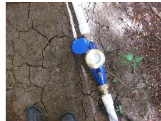
Medidores de Agua Campo de aspersión