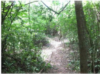
Apertura de trochas

Durante la etapa de topografía ingresan cuadrillas a campo con el fin de hacer una demarcación de las líneas receptoras y salvos, por los salvos se marcan puntos cada 60 metros donde se ubica una tarjeta roja que indica un Sps (punto de disparo). En las líneas receptoras cada 60 metros se ubica una tarjeta blanca la cual nos indica un punto receptor. Para el paso de estas cuadrillas se adecuan senderos de un metro de ancho donde se respetan los parámetros de corte y apertura de trocha que nos da la guía ambiental, DAP 10 cm. En bosques de galería trocha tipo tunes 1mt ancho X 2mt altura.