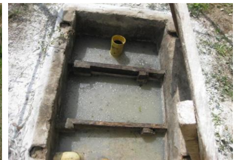
Exterior de las trampas de grasa Interior de las trampas de grasa