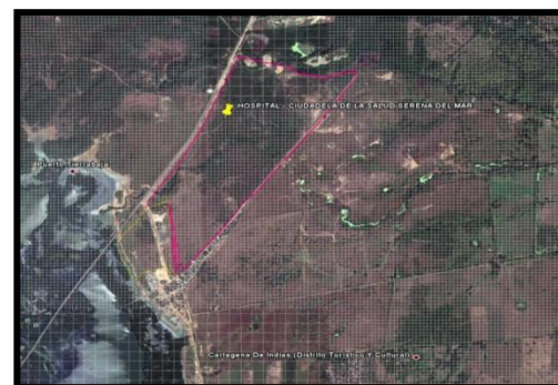
Figura No.2.1. Ubicación del área bruta del predio

“(…) 2. LOCALIZACION Y DESCRIPCION DEL PROYECTO