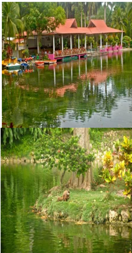
Lagos del Centro Recreacional