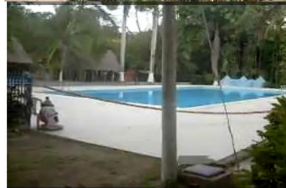
Piscinas para adultos para niños