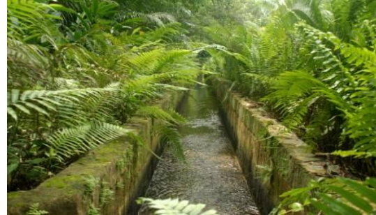
Canal hecho en piedra por donde se conduce el agua a piscinas, lago

cemento hasta una caseta de control donde por medio de un sistema manual el líquido se almacena y se distribuye por gravedad a varios sitios de la finca como: