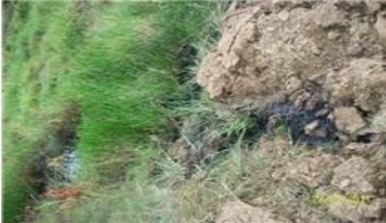
Foto: Constricción de diques de suelo y material vegetal. Foto: Relleno del cuerpo de agua con tierra removida.