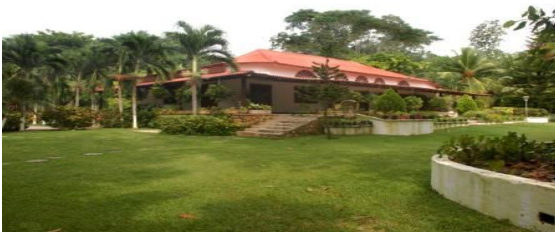
Imagen lago principal del Centro Recreacional Los Lagos Casa principal. Obsérvese arboles frutales y ornamentales