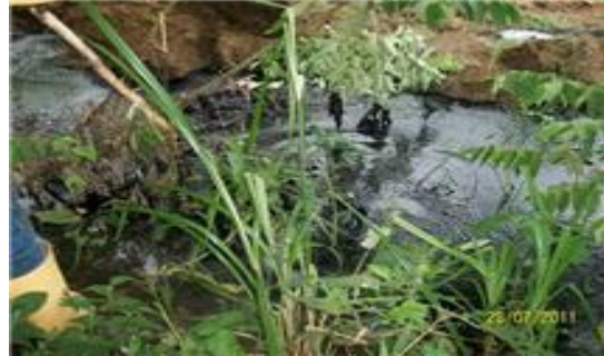
Fotos: Afectación del cuerpo de agua y flora asociada a él.

El líquido vertido recorrió a lo largo del arroyo, 3 kilómetros aproximadamente agua abajo.