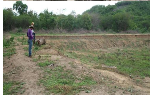
Vista General de la Cámara de Distribución Vista General de la Salida de la Laguna Maduración