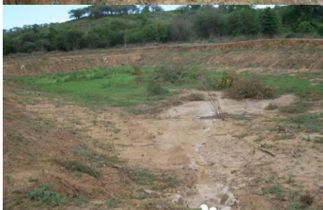
Vista General de la Laguna Facultativa Vista Salida descarga de la estructura de entrada