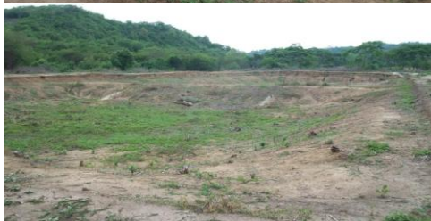
Vista General de la Laguna de Maduración Vista General del Sistema de Lagunaje

La estructura de entrada consta de una canal de llegada, canaleta de aforo tipo Parshall y una cámara de distribución, toda esta estructura es en mampostería a excepción de la canaleta de aforo que es en concreto simple, la cual se encuentra en buen estado, tal como se evidencia en el registro fotográfico, el sistema de Lagunaje tiene un área de 6190.14 m 2 estas se encuentran localizada en el área rural en sector Bota Burro, de los cuales 3954.12 corresponde a la laguna facultativa y 2236.02 m 2 a la laguna de maduración. Dado la edad de la estructura se ha presentado un deterioro en los taludes internos; pese a que se realizó una limpieza para poder realizar el levantamiento topográfico de las mismas, todavía se encuentran troncos con raíces que se requieren sacar para poder poner en funcionamiento el sistema, además estas no se encuentran impermeabilizadas. Tiene una profundidad de 1.750 metros para la laguna facultativa y 2.015 metros para laguna de maduración. En general esta estructura se puede recuperar.